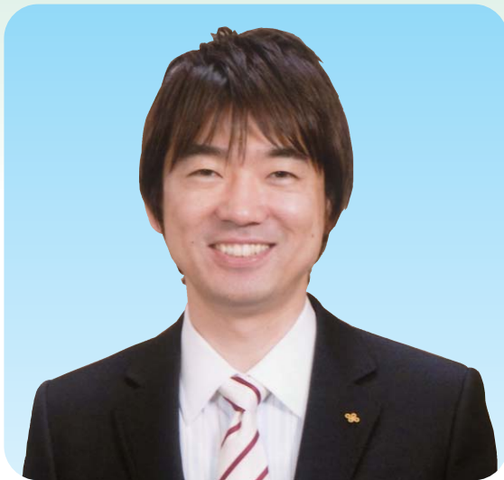
大阪府知事 橋下 徹

社団法人日本理容美容教育センター主催の第1回全国理容美容学生技術大会の御盛会を心からお祝い申し上げます。